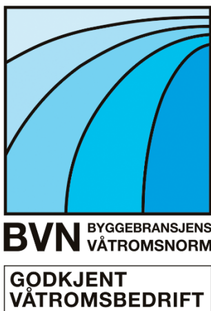
Fig. 81 Logo for ordningen «Godkjent våtromsbedrift i henhold til BVN»

Etter fem år må det sendes inn ny søknad om fornyelse av godkjenningen. FFV skal varsles umiddelbart ved endringer som er av betydning for godkjenningen. Se pkt. 83.